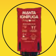
Bolsa protectora con indicaciones de uso