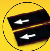
Tiras de extracción indicadas y reforzadas